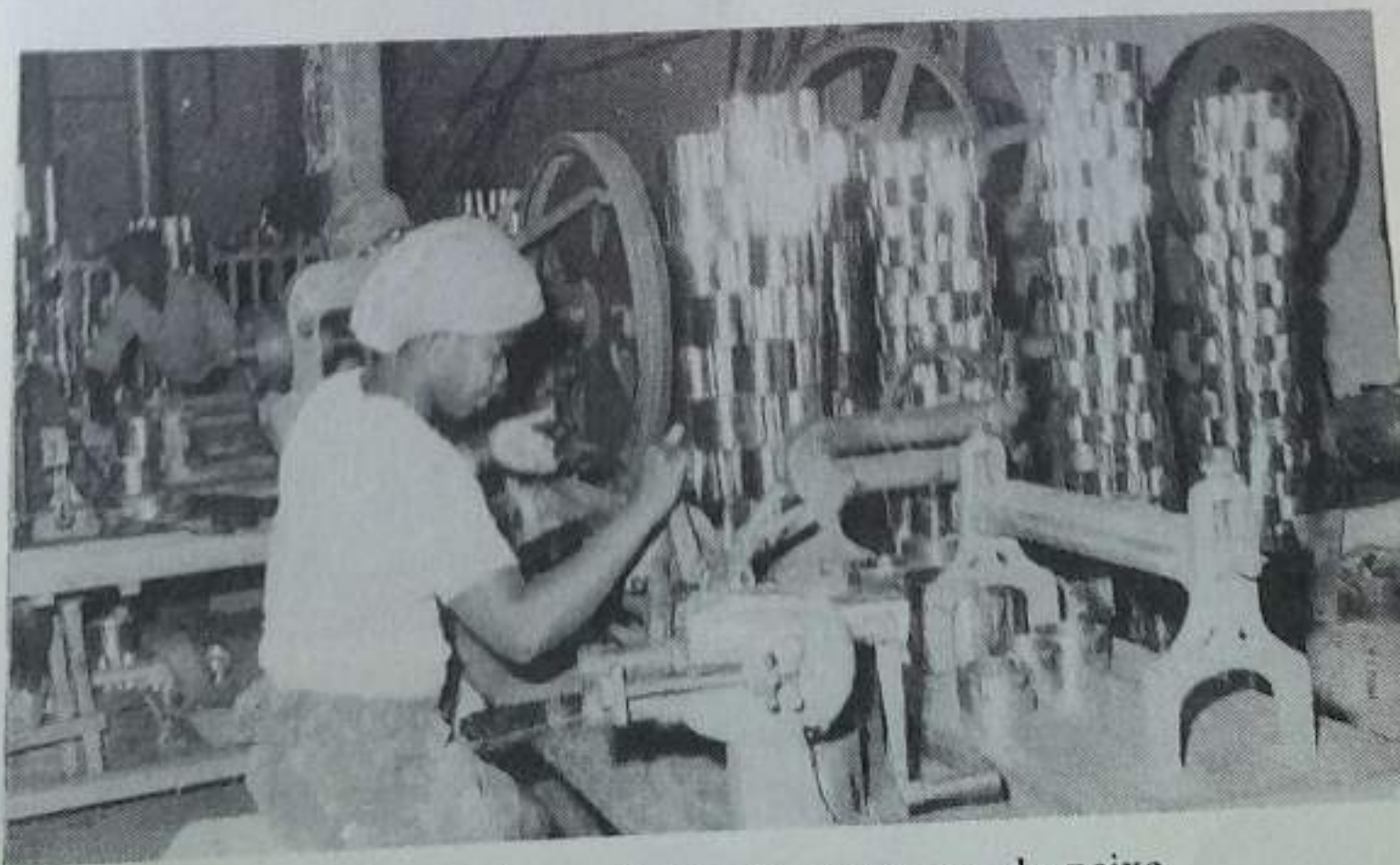
Unidade de produção de conservas de peixe

A instalação de pequenas indústrias tem o objectivo de substituir a importação excessiva pela produção local.